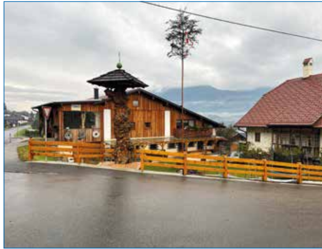
Brugger in Unterhaus