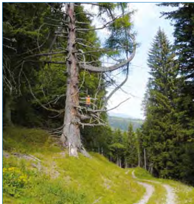
Natur baut Skulptur

Das Projekt wird demnächst öffentlich ausgeschrieben und könnte somit im Herbst begonnen werden. Ein Informationsabend zu diesem Thema u.A. ist für die nächsten Wochen eingeplant.