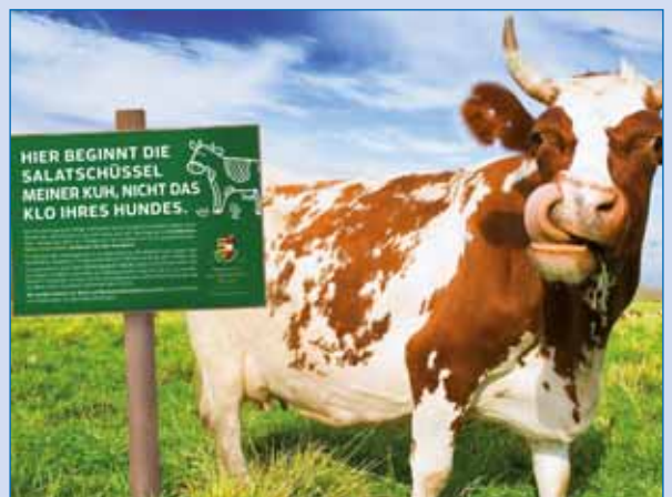
Hundekot im Gras und Heu kann Krankheiten und Fehlgeburten bei Rindern verursachen

Im Übrigen sind Leine oder Maulkorb beim Aufenthalt außerhalb eingefriedeter Grundflächen jedenfalls mitzuführen und im Falle einer unerwarteten Situation zu verwenden (Kärntner Landessicherheitsgesetz – K-LSiG).